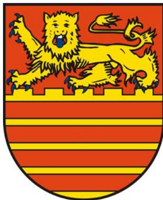
Bad Lauterberg im Harz