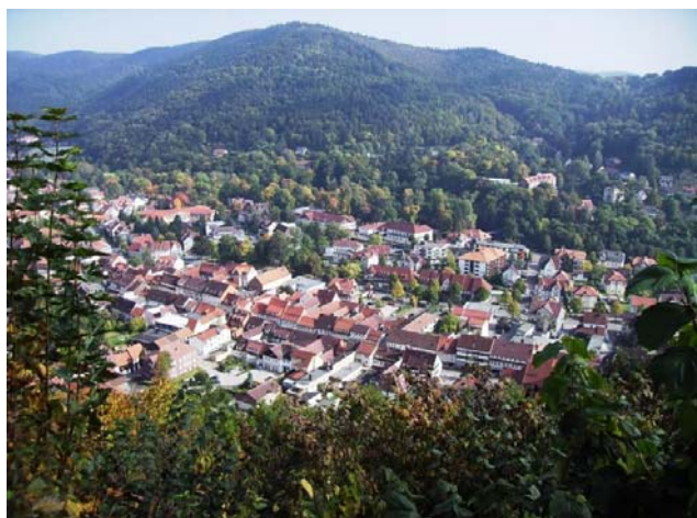
Blick vom Hausberg auf die Stadt Bad Lauterberg

Die Stadt liegt in einem Tal von Harzer Bergen umgeben und ist eine der ältesten Bergstädte im Harz.