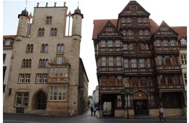
Tempelhaus und Wedekindhaus

Nach der Stadtführung haben wir eine Pause im historischen Knochenhaueramtshaus eingeplant.