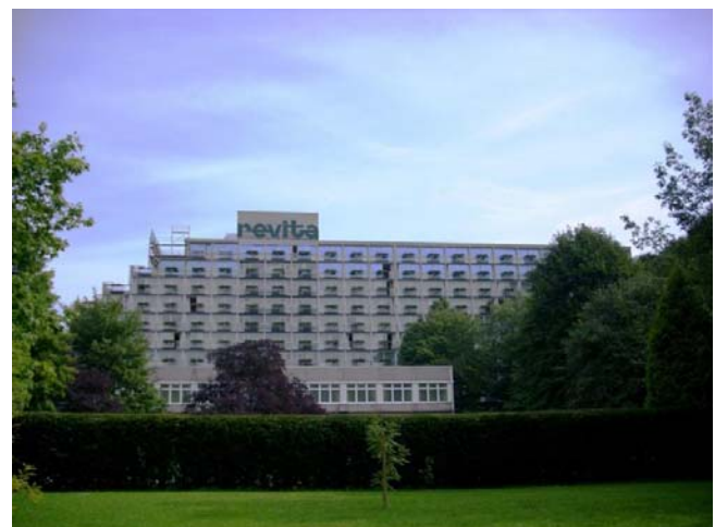
Tagungs- und Eventhotel Revita