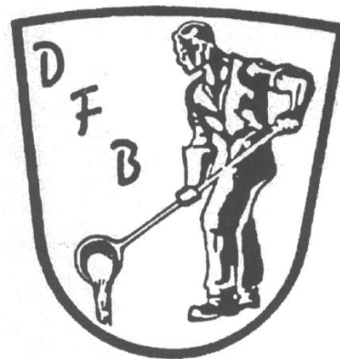
Deutscher Formermeister Bund e.V. seit 1907