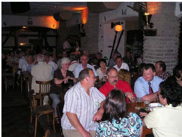
Blick in den Abend des OV Isselburg-Bocholt

Nach dem gemeinsamen Abendessen fand in einem separaten Bereich der Ortsvereinsabend statt. Leichte Anlaufschwierigkeiten (eine nicht genügende Anzahl von Sitzplätzen) wurden dank des schnellen Reagierens aller Beteiligten schnell gemeistert. In gemütlich fröhlicher Runde, mit Musik und einigen Darbietungen junger Künstler (Bauchtanz, Jonglieren und Einrad) aus der Region, klang so der erste Tag der Tagung aus. Wem dies noch nicht genug war, konnte sich in der Unterhaltungsmeile des Freizeitparks noch vergnügen.