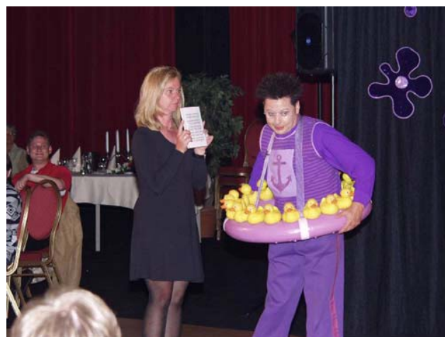
Blub mit dem Quarkophon und Assistentin

Die Festrede teilte der Bundesvorsitzende in drei Teile auf. Den Arbeitsteil, den Teil der Ehrungen und Danksagungen und dem Teil für 100 Jahre DFB.