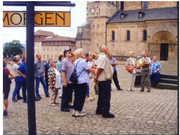
Der OV Nürnberg bei der Stadtbesichtigung in Bamberg

Mit 11 Personen war der Ortsverein Nürnberg bei der Bundes-tagung vom 15. – 16. Mai 2008 im „Wunderland Kalkar“ vertreten. Mit 29 Personen machte der OV. Nürnberg einen Ausflug nach Bamberg zur Eisengießerei Müller.