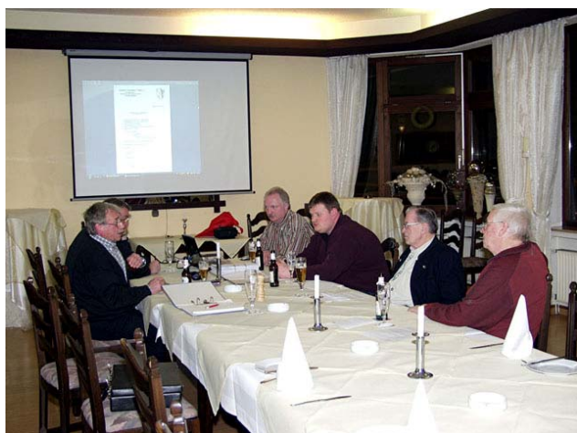
Blick in die Jahreshauptversammlung