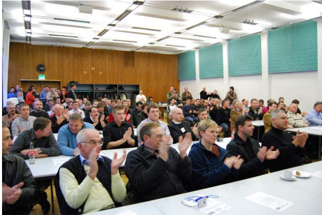
Blick in die Aula der Wilhelm Maybach Schule

Unter reger Teilnahme von Gästen, Meister- und Technikerschülern fand am 05.12.2008 in der Wilhelm-Maybach-Schule die Barbara-Feier statt, die alljährlich vom Deutschen Formermeister Bund e.V. Ortsverein Stuttgart und der Wilhelm-Maybach-Schule organisiert wird. Bei den Fachvorträgen waren ca. 120 Teilnehmer anwesend.