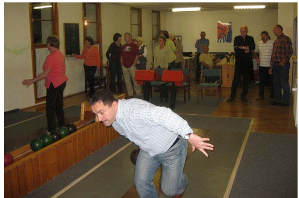
Auch die Gemütlichkeit kam nicht zu kurz

Zum Abschluss der Besichtigung gab es dann noch Kaffee und selbstgebackenen Kuchen, bevor wir uns wieder auf den Rückweg ins Hotel begaben. Am Abend ging es dann zur Hoteleigenen Kegelbahn, wo wir nach sportlicher Betätigung das Wochenende in gemütlicher Runde ausklingen ließen.