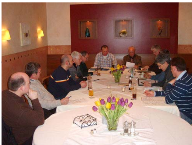
Blick in die Jahreshauptversammlung