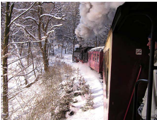
Mit der Harzer Schmalspurbahn Bahn im Winter zum Brocken