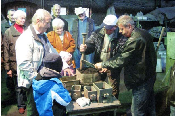
Formen will gelernt sein

Wieder in der Gießereihalle angekommen war der Ofen bereits vorgeheizt und unser mitgebrachtes Aluminium fertig zum Gießen. Es standen auch schon Formkästen bereit und alle, die Lust dazu hatten, konnten mal zeigen, wie sie formen können. Das ließen natürlich sich die Former im Ruhestand nicht zweimal sagen und gingen ans Werk. Es wurde ein richtiger Wettbewerb, wer am besten formen kann. Die Männer hätten noch einige Stunden länger im „Sand spielen“ können. Aber auch für die mitgereisten Kinder und Frauen war der Nachmittag sehr interessant. So entstanden dann einige Plaketten, zwei davon sind auf dem Gruppenbild zu sehen.