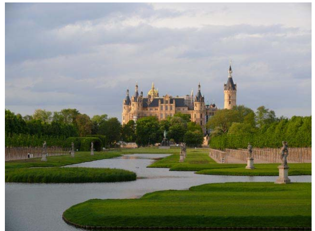
Das BUGA Gelände am Schweriner-Schloss

Da unter dem Tagungsordnungspunkt „Verschiedenes und Anfragen“ keine weiteren Wortmeldungen der Mitglieder erfolgten, berichtete der 1. Vorsitzende über den Planungsstand des OV-Vorstandes zur 22. Bezirkstagung in Walkenried/Harz. Abschließend verlas er eine Einladung der VDG-Bezirksgruppe Niedersachsen zu Ihrem 1. Sprechabend 2009 in Elze. Die Einladung wurde von 7 Mitgliedern angenommen.