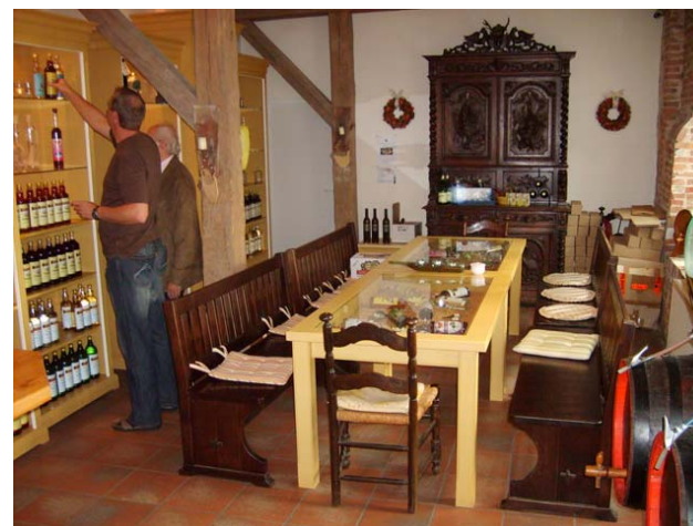
Blick in den Verkaufsraum der „Geuting Gutsbrennerei“

Betriebsbesichtigung: Besichtigung der "Geuting Gutsbrennerei" in Bocholt-Spork, Brennereiweg 8,