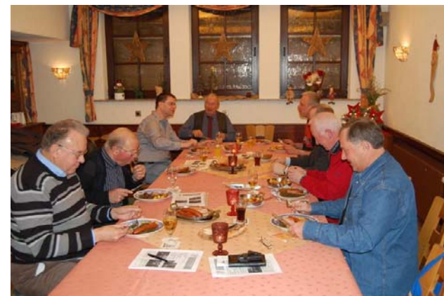
Die Kollegen des OV Iserlohn beim traditionellem Grünkohlessen