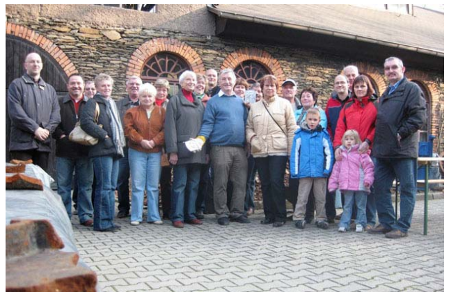
Die Teilnehmer beim Gruppenfoto

Heute werden vorwiegend Kunstwerke und Gussteile für denkmalgeschützte Gebäude hergestellt. Dafür wird dann auch mal der Kupolofen angeheizt.