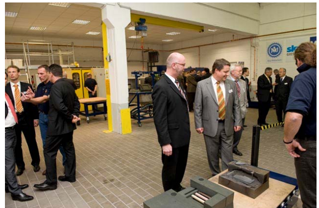
Blick in das neue Technikum

Dass das Thema Nachhaltigkeit auch innerhalb der ASK umgesetzt wird, kann man auch daran erkennen, dass im neuen Technikum der Umweltschutz eine große Rolle spielt: Es ist mit modernsten Entstaubungs- und Wäschersystemen ausgestattet. ASK Chemicals hat in das Gießerei-Technikum 1,5 Millionen Euro investiert, damit den Forschungsstandort Hilden gestärkt und neue Arbeitsplätze geschaffen. Das Unternehmen beschäftigt in Hilden und Wülfrath 159 Mitarbeiter und 13 Auszubildende.